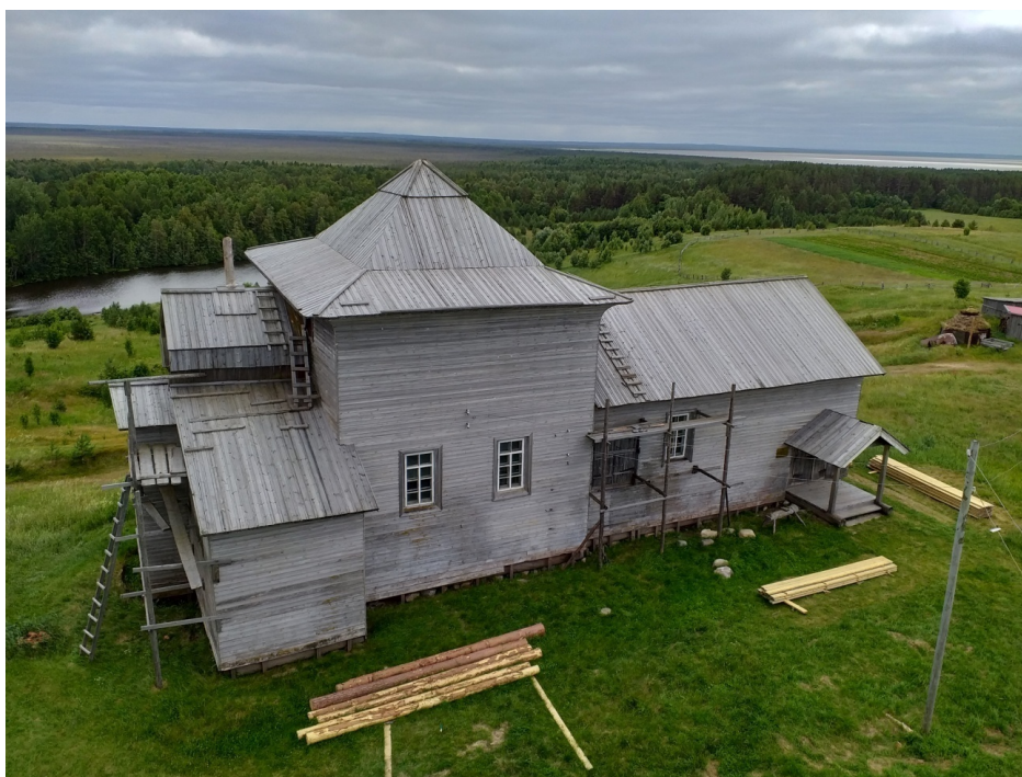
Рис. 2 – Вид на Введенскую церковь с колокольни Ворзозгорского погоста. 2019 г.

В настоящей статье представлены материалы по строительной истории одного из этих памятников – церкви Введения во храм Пресвятой Богородицы (1793). Сохранившаяся на сегодняшний день церковь состоит из основного храмового четверика, трехпрестольного алтаря сложной формы, прямоугольной трапезной и сеней, расположенных относительно продольной оси (рис. 2). К алтарю, представляющему собой комбинацию из двух прямоугольных в плане объемов, с северной стороны примыкает вынесенная за пределы бокового фасада пономарня XIX в. (рис. 3). Основной четверик покрыт четырехскатной крышей с полницами. Первоначально он завершался пятью главами, которые были утрачены. Алтарь покрыт крышами с прямыми скатами, над которыми возвышается бочка. Над бочкой также существовала главка. Центральная часть алтаря имеет самостоятельное двускатное покрытие (рис. 4). Трапезная и сени покрыты единой двухскатной крышей. Внутри все помещения перекрыты плоскими перекрытиями. Снаружи бревчатые стены покрыты дощатой обшивкой. На всех фасадах расположены регулярные ряды окон.