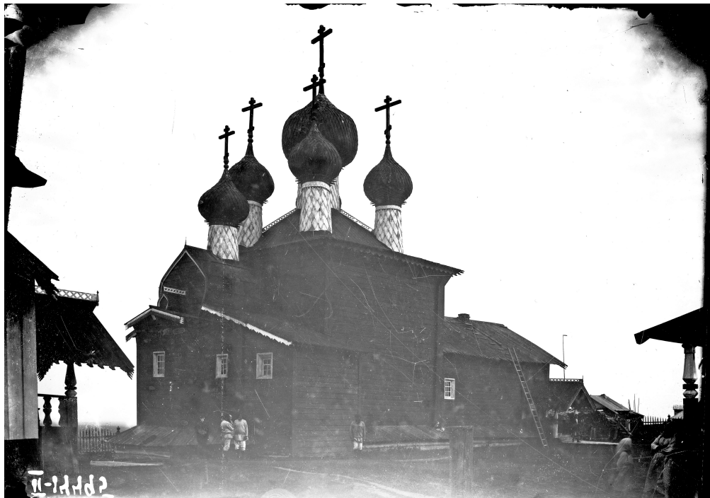
Рис. 7 – Введенская церковь, вид с северо-востока. 1886 г. Нег. II. 14495.

В 1910 г. была проведена страховая оценка строений Ворзогорского погоста. В указанном документе сохранилось следующее описание Введенской церкви: «Введенская церковь – деревянная, на камнях, снаружи обшита тесом и покрашена масляной краской, внутри в церкви обшита тесом и покрашена, а в притворе обшита парусиной и