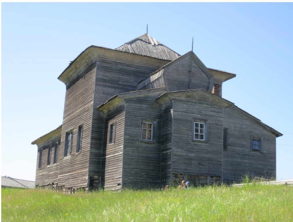
Рис. 4 – Введенская церковь в с. Ворзогоры. Вид с востока. 2012 г.

Введенская церковь являет собой образец народной архитектуры Онежского Поморья, объемно-пространственное решение которого не подвергалось значительным изменениям вплоть до 1930-х гг. Ценность памятника заключается также и в том, что он сохранился в составе комплекса-«тройки» – увы, это явление уже считается уникальным для Русского Севера (рис. 5). Ранее обезглавленный и полностью утративший интерьер храм в настоящее время восстанавливается и постепенно обретает свой исторический облик.