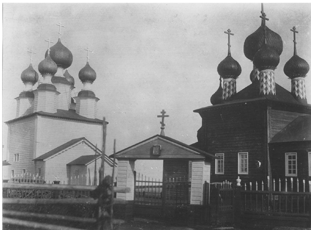
Рис. 10 – Окна на северном фасаде Введенской церкви. Начало XX в.

При сравнении фотографий 1886 г. и начала XX в. можно заметить, что к 1910-м гг. на северном фасаде были прорублены высокие окна, оформленные рамочными наличниками, а кокошник, первоначально украшавший алтарный прируб, был уже утрачен (рис. 10).