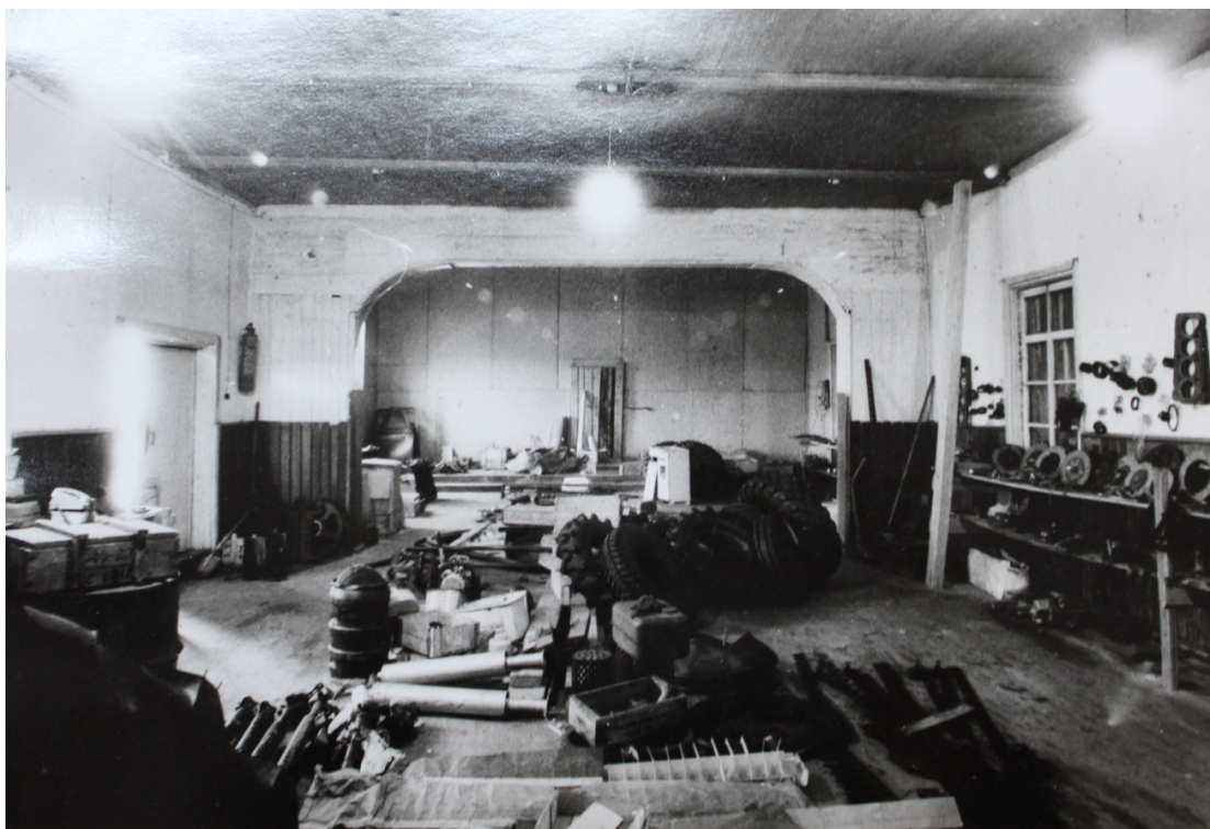
Рис. 14 – Интерьер Введенского храма. 1991 г.

В 1950 г. Ворзогорский сельсовет обратился в отдел по делам архитектуры Архангельского облисполкома с просьбой обследовать и дать экспертное заключение о состоянии ворзогорских культовых построек и возможности их дальнейшего использования.