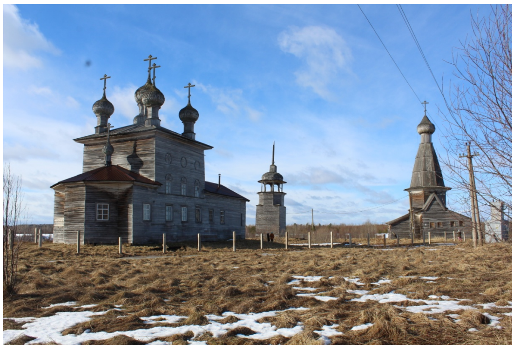
Рис. 19 – Храмовый комплекс Малошуйского погоста, Онежский район Архангельской области. Слева – церковь Сретения Господня (1873). 2020 г.