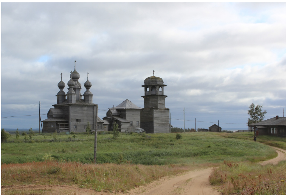
Рис. 1 – Комплекс Ворзозгорского погоста. 2019 г.

В настоящей статье представлены материалы по строительной истории одного из этих памятников – церкви Введения во храм Пресвятой Богородицы (1793). Сохранившаяся на сегодняшний день церковь состоит из основного храмового четверика, трехпрестольного алтаря сложной формы, прямоугольной трапезной и сеней, расположенных относительно продольной оси (рис. 2). К алтарю, представляющему собой комбинацию из двух прямоугольных в плане объемов, с северной стороны примыкает вынесенная за пределы бокового фасада пономарня XIX в. (рис. 3). Основной четверик покрыт четырехскатной крышей с полницами. Первоначально он завершался пятью главами, которые были утрачены. Алтарь покрыт крышами с прямыми скатами, над которыми возвышается бочка. Над бочкой также существовала главка. Центральная часть алтаря имеет самостоятельное двускатное покрытие (рис. 4). Трапезная и сени покрыты единой двухскатной крышей. Внутри все помещения перекрыты плоскими перекрытиями. Снаружи бревчатые стены покрыты дощатой обшивкой. На всех фасадах расположены регулярные ряды окон.