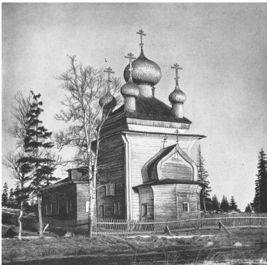
Рис. 22 – Церковь Петра и Павла в с. Вирма, XVII в. [24, С. 152].

Таким образом, церковь Введения во храм Пресвятой Богородицы можно считать ярким примером традиционного типа деревянного храма «на каменное дело», сформировавшегося в беломорском регионе и впитавшего черты архитектуры крупных монастырей. Благодаря сочетанию различных приемов народного храмового зодчества строителями церкви был создан целостный, выразительный образ, который стал неотъемлемой частью стройного аккорда ворзогорского «тройника». По иронии судьбы, приспособление храма под отопляемый клуб в советское время позволило сохранить большую часть подлинных конструкций здания, а проводимые в настоящее время работы по воссозданию его завершения дают надежду на то, что вскоре мы сможем увидеть ворзогорский храмовый комплекс во всей красе его силуэта.