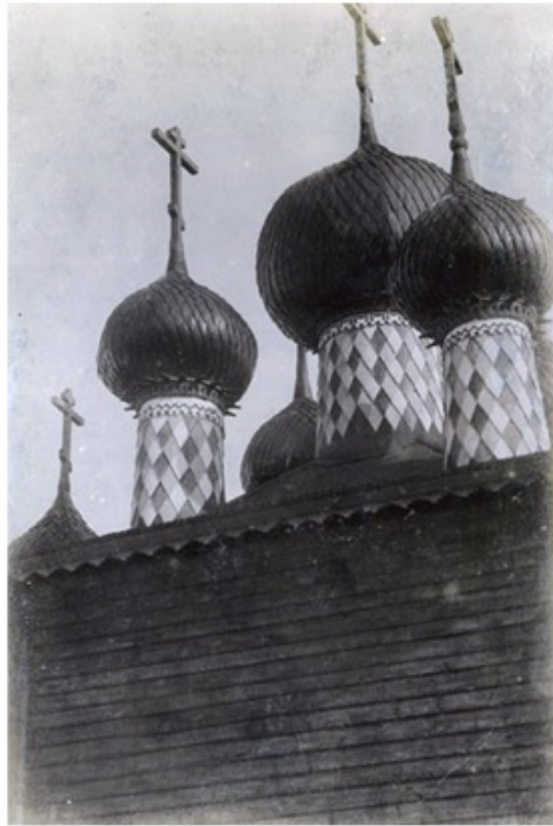
Рис. 11 – Завершение Введенской церкви. Копия с фотографии В. А. Плотникова начала XX в. Из коллекции А. А. Чемесова.

наличники в оформлении окон с мелкой расстекловкой – выделены светлой краской; лемех на шейках был контрастно окрашен в шахматном порядке (рис. 11).