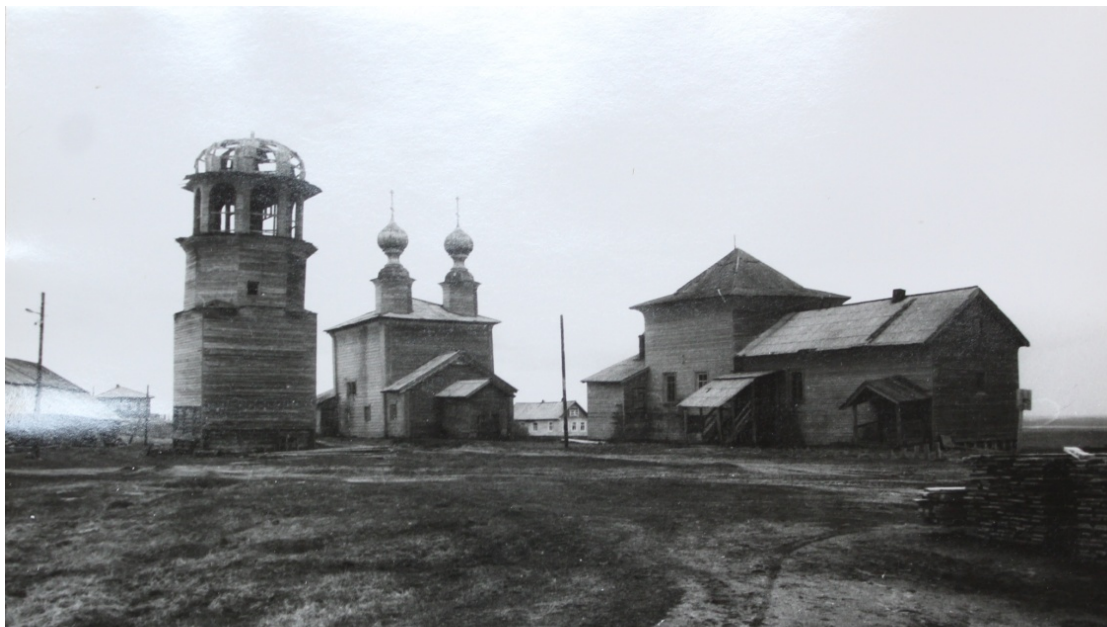
Рис. 15 – Ворзогорский погост. Вид с северо-запада. 1991 г.

Предполагалось, что в 1955 г. Ворзогоры посетит еще одна комиссия, включающая в свой состав специалистов Академии Наук, но, по всей видимости, этот визит не состоялся. Следующее обследование ворзогорских памятников, по итогам которого объекты были паспортизированы, произошло в конце 1980-х – начале 1990-х годов. На фотографиях этого периода заметно, что никакие работы из сформированного в 1954 г. списка проведены не были (рис. 15).