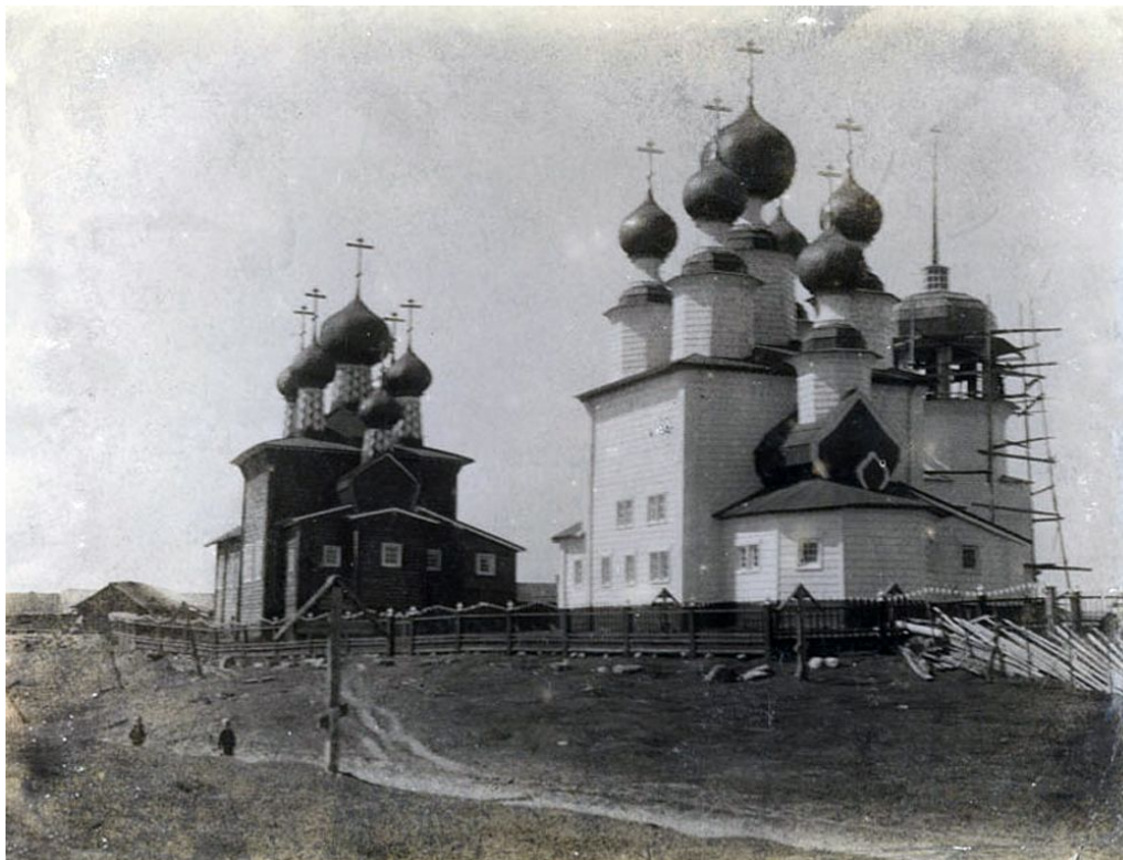
Рис. 8 – Введенский и Никольский храмы. [17, С. 96]

В 1911 г. в очередном выпуске «Известий Императорской Археологической Комиссии» был опубликован фотоснимок В. А. Плотникова, запечатлевшего общий вид Ворзогорского погоста с юго-востока (рис. 8). В статье о погосте, иллюстрированной данной фотографией, дается описание только Никольского храма; описание Введенской церкви составлено не было.