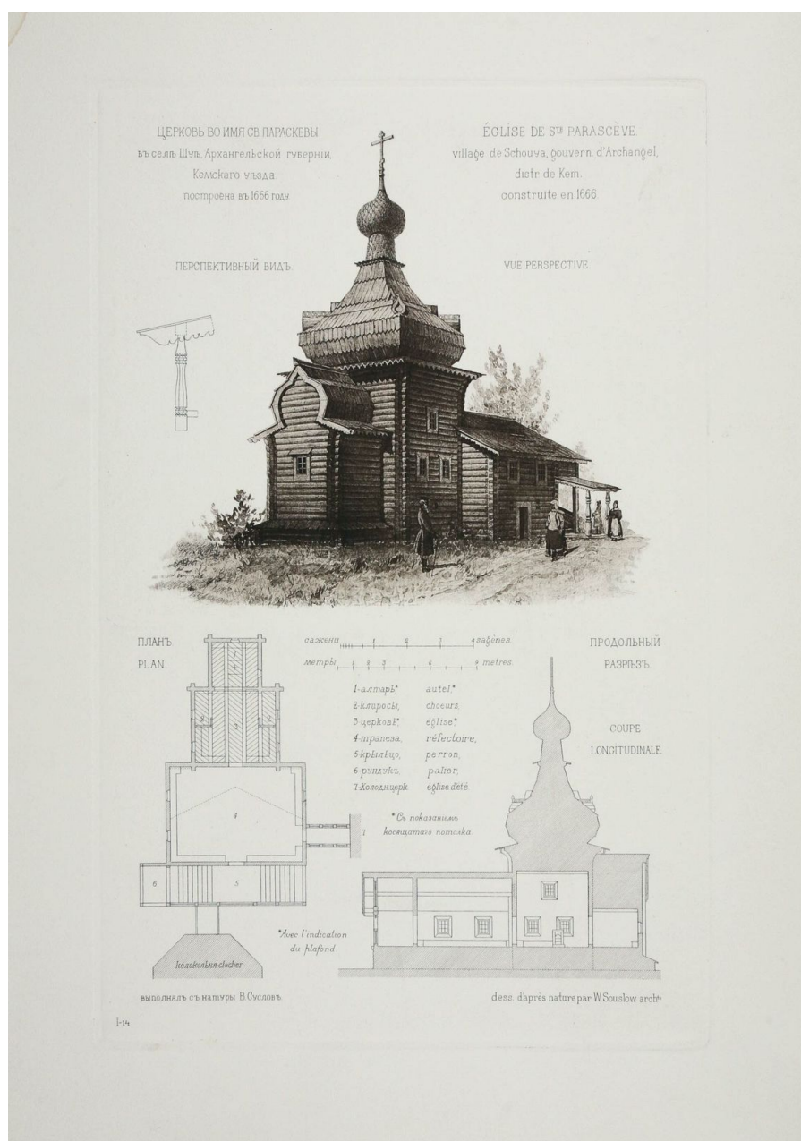
Рис. 21 – Церковь Параскевы Пятницы в Шуерецком (1666). Обмер и рисунок В. В. Сулова [23].

Несмотря на это совпадение, ворзогорскую Введенскую церковь необходимо рассматривать именно в контексте народной архитектуры Поморья. Композиция пятиглавого, кубического в объеме храма обогащена живописными элементами, характерными для традиционного деревянного зодчества. Алтарная часть состоит из двух прямоугольных в плане объемов, увенчанных бочкой с кокошником (утрачен). Такое решение является вариацией на тему архаичного прямоугольного алтарного прируба с бочкой в завершении, существовавшего, например, у ныне утраченной церкви Параскевы Пятницы в с. Шуерецкое Кемского уезда (1666) (рис. 21). Крутой повал в завершении основного объема отсылает к архитектуре беломорских храмов XVII в. с массивным четвериком, среди которых можно назвать ту же церковь Параскевы Пятницы, а также церковь Петра и Павла в карельском селе Вирма (рис. 22). Приподнятое в центре покрытие сруба Введенского храма с полицами по краям – также характерная региональная черта: ее мы находим в завершении алтаря Никольской церкви в Малешуйке (1638); аналогичное покрытие имели «рукава» крестообразного сруба Никольского храма в Шуерецком (XVI-XVIII вв.; утрачен). Декоративную обработку кокошниками также можно отнести к устойчивым особенностям деревянной архитектуры нижней Онеги и Онежского Поморья.