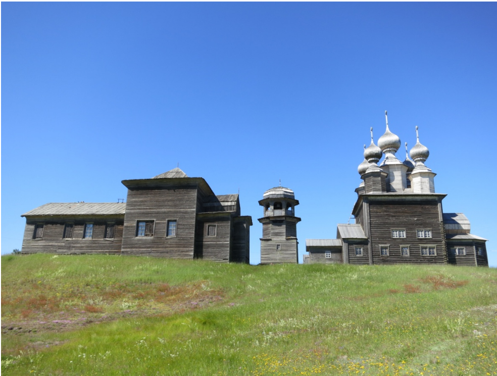
Рис. 5 – Введенская церковь в с. Ворзогоры. Вид с юга. 2012 г.