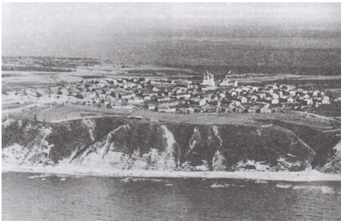
Рис. 13 – Вид на с. Ворзогоры из кабины дирижабля «Граф Цепелин». 1931 г.

На фотографии, выполненной с дирижабля «Граф Цепелин» несколько ранее – в 1931 г., – несмотря на низкое качество, заметно, что в это время на Введенской церкви еще сохранялась как минимум одна центральная глава. То есть, завершение храма было полностью уничтожено в период между 1931 и 1939 гг. (рис. 13).