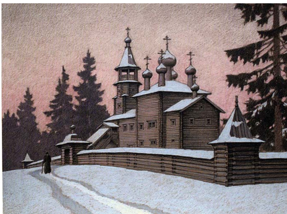
Рис. 18 – Церковь Троицы Живоначальной в Юрьегогорской пустыни (1796). Реконструкция А. Б. Бодэ.

В русле этой традиции в Онежском уезде были возведены хронологически близкая к Введенской церкви Троицы Живоначальной в Юрьегогорской пустыни (1796; утрачена) (рис. 18) и Сретенская церковь в с. Малошуйка (1873) (рис. 19), в Кемском уезде – церковь Николая Чудотворца в с. Сумский Посад (1767; утрачена) (рис. 20).