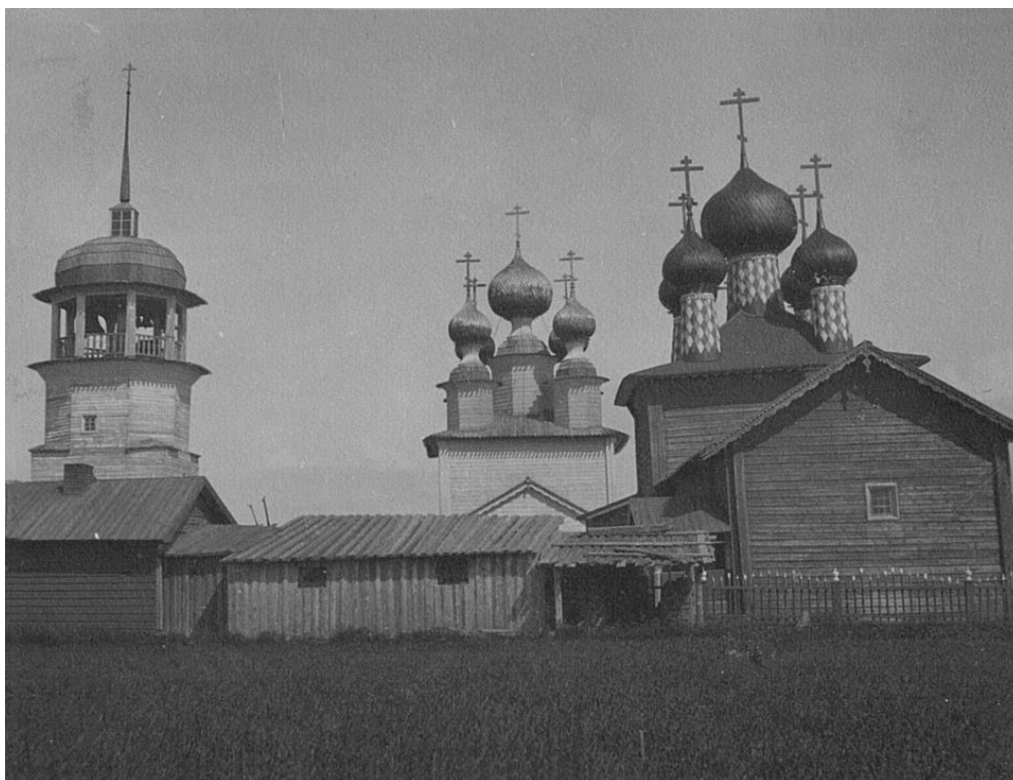
Рис. 9 – Церковь в селе Кондратове [18].

При сравнении фотографий 1886 г. и начала XX в. можно заметить, что к 1910-м гг. на северном фасаде были прорублены высокие окна, оформленные рамочными наличниками, а кокошник, первоначально украшавший алтарный прируб, был уже утрачен (рис. 10).