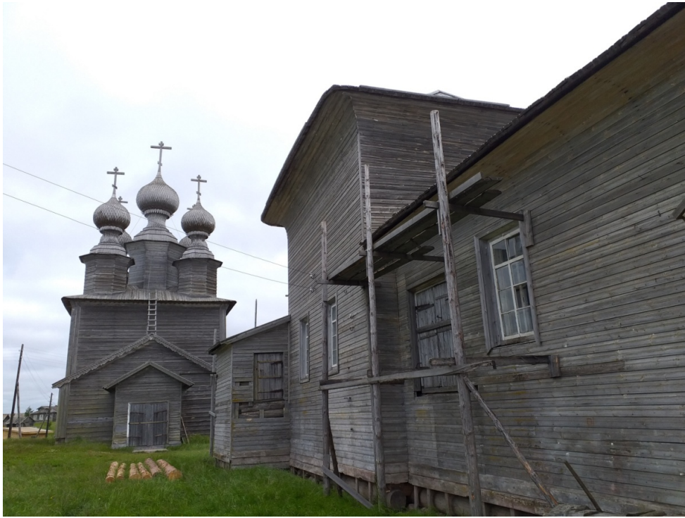
Рис. 3 – Вид на Никольскую церковь Ворзогорского погоста. Справа – северный фасад церкви Введения. 2019 г.