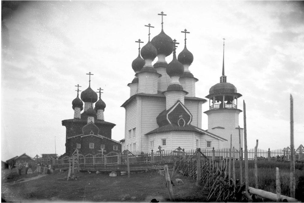
Рис. 6 – Церкви в с. Ворзогоры Архангельской губ. Фото В. В. Сулова. 1886 г. Фотоархив ИИМК РАН. Нег. II. 14404.

В 1886 г. Ворзогоры посетил архитектор и исследователь русского зодчества академик В. В. Суслов. В краткой заметке о селе он отметил сходные черты в облике Введенской и обновленной в 1840-х гг. Никольской церковей: на главных квадратных срубах возвышается по пять глав; пятиугольные срубы алтарей завершаются крышами бочечной формы. С западной стороны к церквям прилегают паперты, и к ним открытые лестницы: те и другие перекрыты двускатными крышами. Все здания обшиты тесом [15, С. 42] (рис. 6, 7).