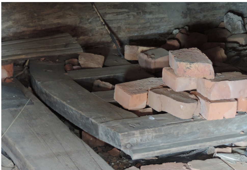
Рис. 17 – Подлинная решетчатая дверь в подклете Введенской церкви. 2019 г.

В 2018 г. в подклете под грудой опилок и строительных отходов была обнаружена массивная, хорошо сохранившаяся решетчатая дверь. Натурное обследование ценной находки позволило предположить, что это одна из дверей, установленных при постройке храма между трапезной и церковью и упомянутых в описи 1803 г. (рис. 17).