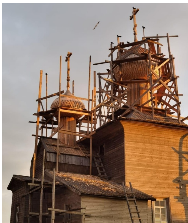
Рис. 16 – Восстановленные главы Введенской церкви. 2020 г.

Возрождение Ворзогорского погоста началось в 2008 г. с реставрации сруба и восстановления глав церкви Николая Чудотворца. Работы над завершением церкви Введения продолжаются и сегодня; изготовлены, обшиты лемехом и установлены две главы – крупная центральная и малая главка на алтаре (рис. 16).