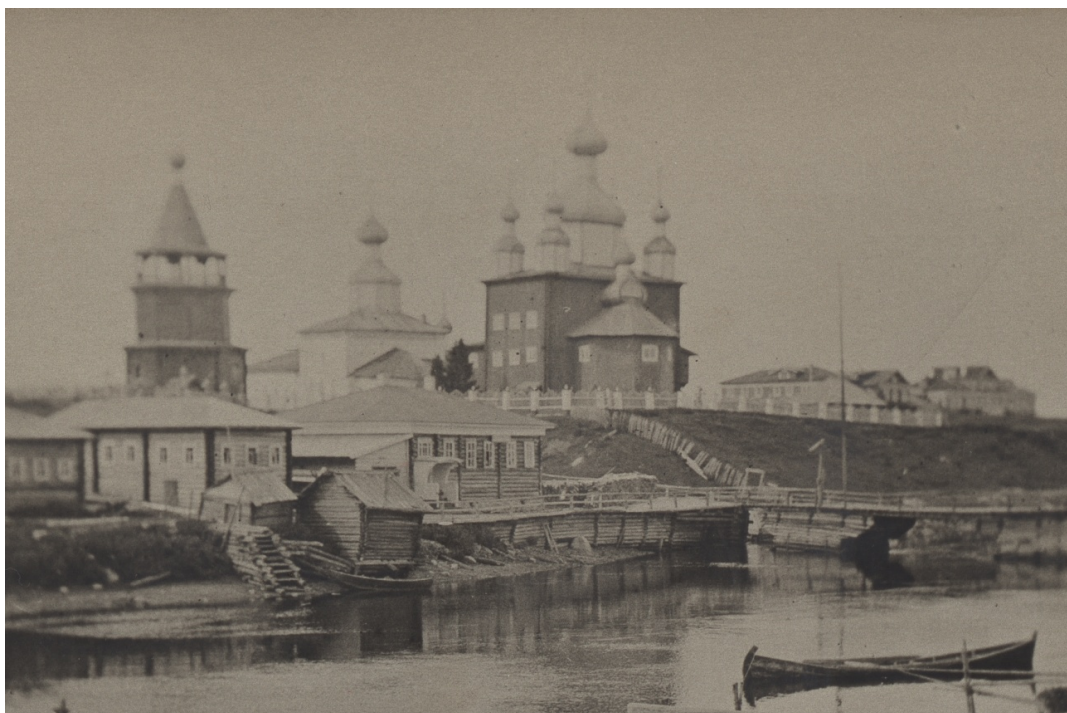
Рис. 20 – Сумский Посад. На переднем плане – церковь Николая Чудотворца (1767). Начало XX в. [22, Л. 1]

Никольская церковь Ворзогорского погоста, также представляющая собой массивный, квадратный в плане сруб с компактной группой глав, среди которых выделяется более крупная центральная глава, является, пожалуй, ближайшим аналогом Введенского храма. Однако стоит отметить, что такое объемно-пространственное решение Никольский храм получил в середине XIX в., и, по всей видимости, его авторы ориентировались как раз на облик церкви Введения.