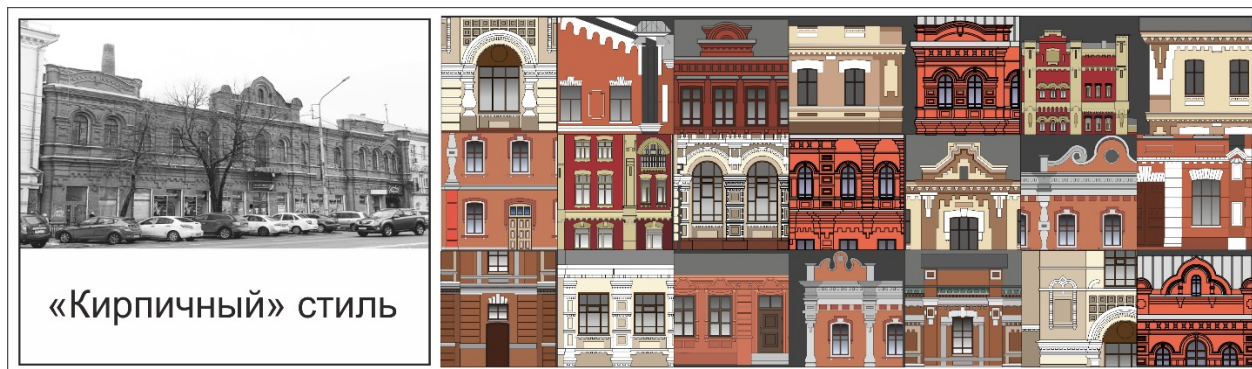
Рис.2 – Цветовой ареал «кирпичной» архитектуры Воронежа конца XIX века

«Кирпичный» стиль, как проявление рационалистического направления в эклектике, начиная с 1870-х годов, был крайне востребован в провинции, в том числе и в губернском городе Воронеж, в силу своих экономических характеристик: относительной дешевизны и небольших сроков строительства, отсутствия штукатурных работ и последующих ремонтов. Цветовой ареал состоял из красно-коричневых цветовых тонов (рис. 2).