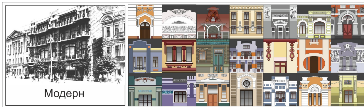
Рис.4 – Цветовой ареал архитектуры модерна г. Воронеж

декоративные керамические многоцветные панно, фасадные фрески и росписи украшали фасады доходных домов, гостиниц, магазинов, торговых зданий и жилых особняков состоятельных горожан. В Воронеже сохранилось не много архитектуры модерна, однако, дошедшие до наших дней постройки удивляют изяществом форм и своеобразием колорита (рис. 4).