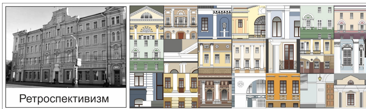
Рис.5 – Стилистический цветовой ареал архитектуры ретроспективизма

Как и модерн, ретроспективизм свободно интерпретирует формами и приемами, являясь, по сути – декоративной стилизацией, в отличие от стилизаторства эклектики, когда прототип «цитировался» один к одному. Воронежский ретроспективизм представлен, в основном, классицистической традицией, со свойственной ей, сдержанной полихромией (рис. 4).