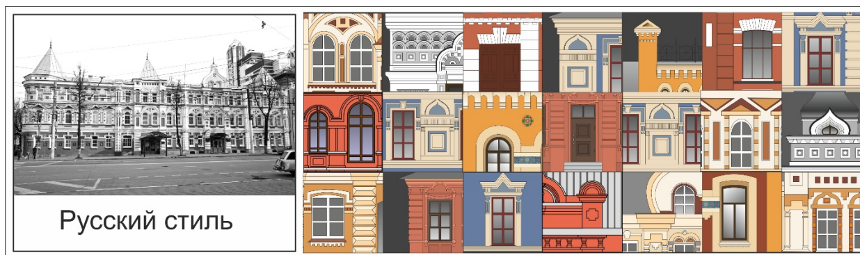
Рис.3 – Стилистический цветовой ареал архитектуры русского стиля

Разновидностью «кирпичной» архитектуры, которая использовала архитектурные формы классицистических традиций, являлся русский стиль, воспроизводивший формы национальной, допетровской и народной архитектуры, заказчиками и покровителями которого было воронежское купечество [10, С. 157]. Область цветового охвата архитектуры русского стиля, не ограничивается только «кирпичными» цветовыми оттенками. Богатство и разнообразие архитектурного колорита вносило использование полихромных керамических изразцов и многоцветных панно и ширинок из глянцевых керамических плиток (рис. 3).