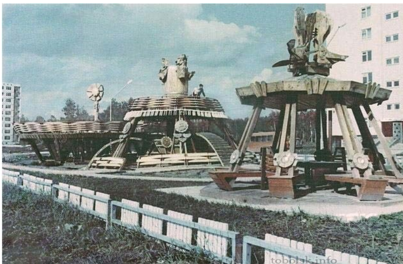
Рисунок 1 - Детская площадка 60-х 70-х годов DOI: https://doi.org/10.18454/mca.2023.43.1.1

История детских площадок начинается около 120 лет назад и за это время они прошли через множество изменений. Началось все с небольшого уголка, где был ящик для игрушек, стол и скамейка, и постепенно переросло в полноценные общественные пространства, оборудованные элементами из экологически чистых материалов. Настоящий прорыв в проектировании детских игровых площадок произошел в 60-70-е годы. Именно в это время к созданию площадок начали привлекать дизайнеров. Даже в СССР, известном своими строгими государственными стандартами и массовым производством, нашли свое место необычные игровые площадки. Деревянные игровые домики, бревенчатые горки, скульптуры витязей, героев мультфильмов – все это стало возможным благодаря труду дизайнеров.