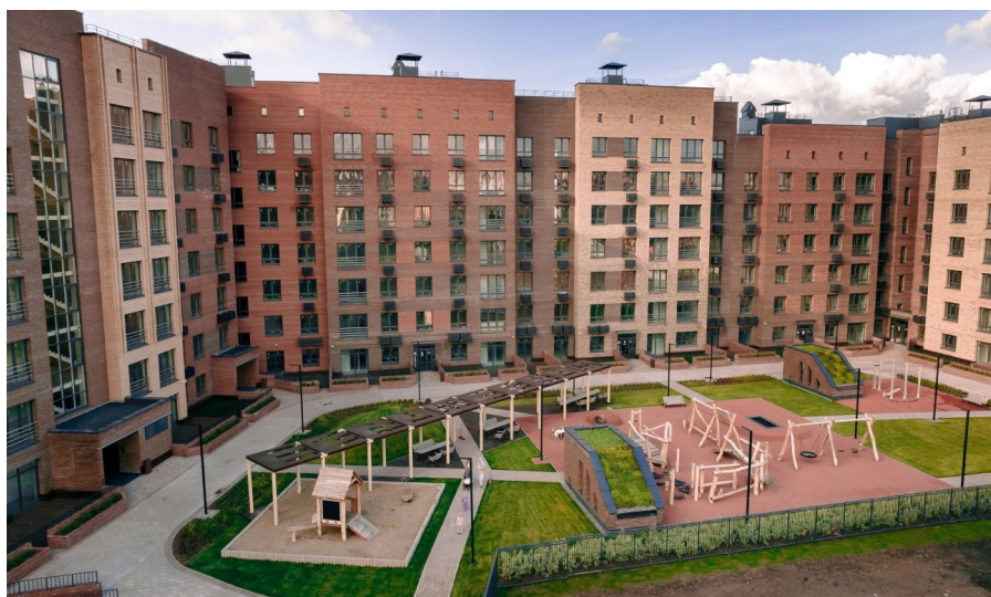
Рисунок 3 - Современный двор новостройки в г. Чебоксары DOI: https://doi.org/10.18454/mca.2023.43.1.3

В 2022 году проведен 6-й Всероссийский конкурс лучших проектов создания комфортной городской среды. На конкурс подано 1688 заявок. В рамках конкурса отобрано 560 проектов-победителей для реализации в 2023-2024 годах из 65 субъектов Российской Федерации. В 2023 году идёт приём заявок на участие в 7-ом Всероссийском конкурсе лучших проектов создания комфортной городской среды. Также с каждым годом увеличивается финансирование проекта из федерального бюджета, а именно, финансирование в 39 млрд руб. – 2019 году возросло до 54,88 млрд руб. – 2023 году.