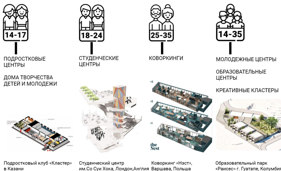
Рисунок 2 - Взаимосвязь возрастных групп и существующих молодежных учреждений

Помимо специализированных пространств, можно отметить существование общих молодежных учреждений, из современных примеров к ним можно отнести молодежные центры (см. рисунок 2). В зависимости от видов деятельности, осуществляемых в них, они могут быть направлены на различные группы молодежи. На данный момент можно встретить большую вариативность в плане функциональной и структурной организации архитектурного пространства, от культурно-образовательных, таких, как Молодежный центр г. Санкт-Петербург по проекту А.А. Столярчука (2014 г.), до рекреационных центров по типу второго дома – Молодежный центр Малинард (Иксель, Бельгия, 2020 г.).