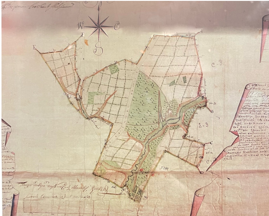
Рисунок 2 - План Вышних и Нижних Горок DOI: https://doi.org/10.18454/mca.2023.38.1.2