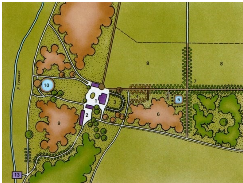
Рисунок 5 - Реконструкция имения Горки на конец XIX- начало XX вв:

1 - главный дом с флигелями; 2 - хозяйственный двор; 3 - партер стриженных лип перед восточным фасадом; 4 - площадка для отдыха; 5 - квадратный пруд; 6 - липовый лес на древних курганах; 7 - двухрядные липовые аллеи; 8 - фруктовый сад; 9 - ландшафтный парк; 10 - круглый пруд; 13 - мельница; 18 - дуб, ориентировочный возраст которого 800 лет