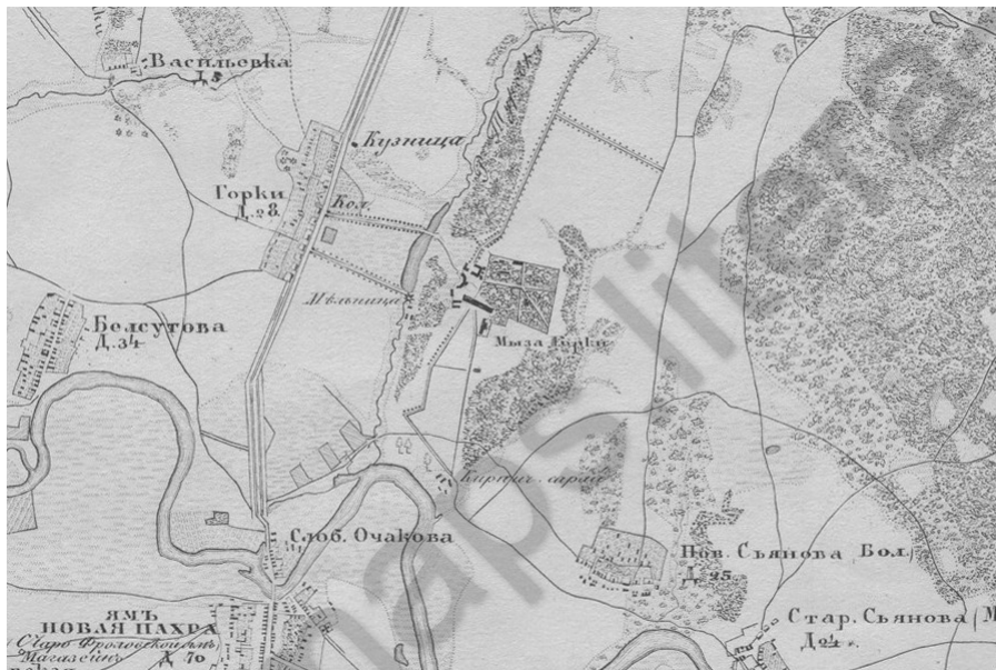
Рисунок 4 - Мыза Горки

DOI: https://doi.org/10.18454/mca.2023.38.1.4