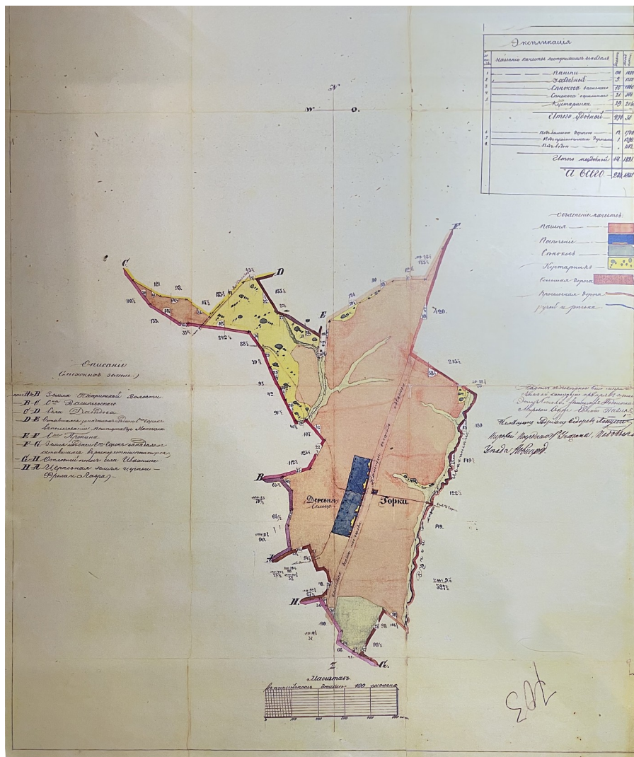
Рисунок 3 - План Московской губернии Подольского уезда, крестьянского надела, принадлежащего Горкам DOI: https://doi.org/10.18454/mca.2023.38.1.3